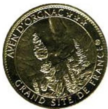
Aven d'Orgnac Grand Site de France