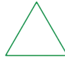
Le triangle équilatéral