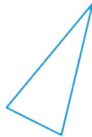
Le triangle isocèle