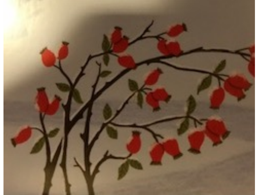
UN ÉGLANTIER (FRUIT : CYNORHODON)