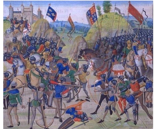
Document B : Bataille de Crécy, 1346. Chronique de Froissart