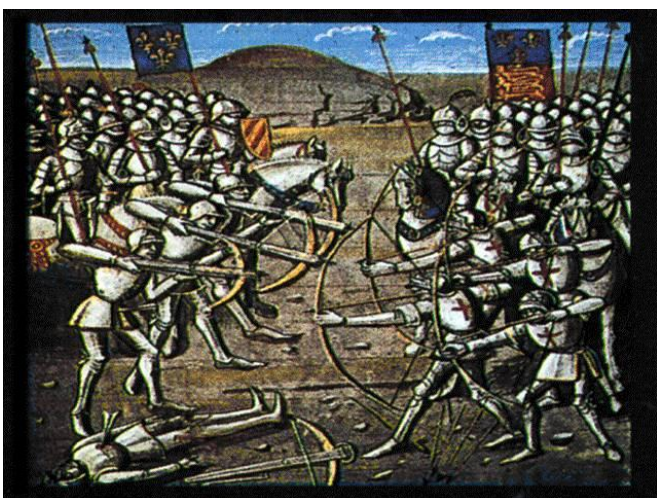
La bataille d'Azincourt

La Guerre s'interrompt pendant la grande peste en 1348 . Suite aux lourdes défaites françaises : Crécy (en 1346) et surtout Azincourt (en 1415), le roi de France Charles VI qui n'a pas toute sa raison, signe le traité de Troyes en 1420 .