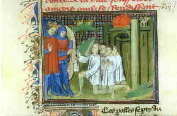
Les bourgeois de Calais présentent les clés de leur ville à Édouard III (1347) Chroniques de Jean Froissart

En 1328, Charles IV, le roi de France meurt sans avoir de fils. Or en France, la loi salique interdit aux femmes d'hériter du trône. Cependant, Édouard III Plantagenet, le roi d'Angleterre réclame le trône de France car sa mère Isabelle est la sœur de Charles IV.