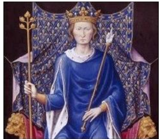
Philippe VI de Valois

Les seigneurs français désignent Philippe VI de Valois comme roi de France. Ces problèmes de descendance et de succession entraînent les deux pays dans un long conflit : la Guerre de cent ans (1337 -1453) .