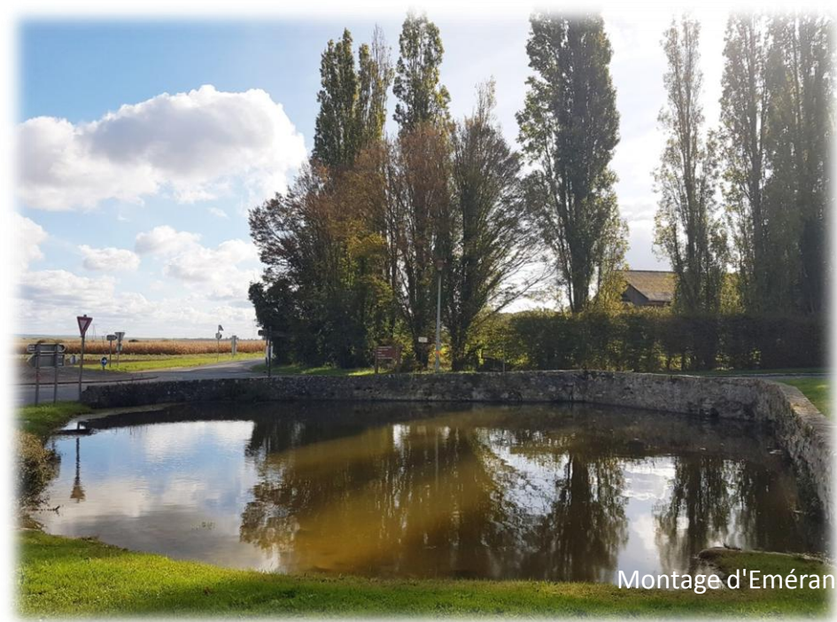
Montage d'Emérance Bétis - 15 octobre 2023