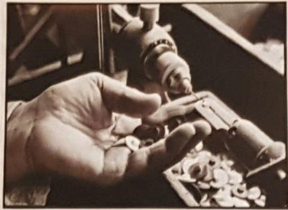
Musée de la Nacre à Méru (Oise)