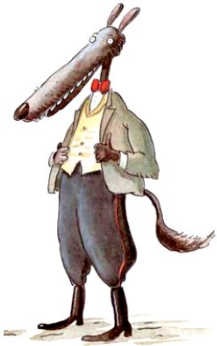
Igor le père

D'après Le déjeuner des loups, G de Pennart