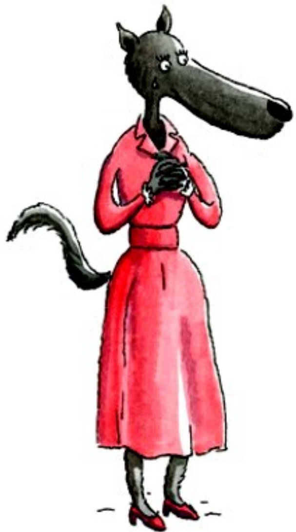
Valentine la mère

D'après Le déjeuner des loups, G de Pennart