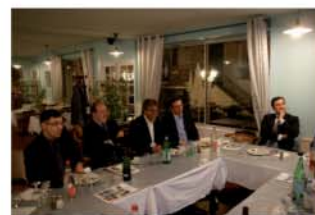
Dîner en Seine et Marne avec le Secrétaire d'Etat Portugais

Nous vous donnons rendez-vous l'année prochaine, en Avril 2013 et en octobre 2012 pour une rencontre avec les élus du Finistère avec notre Forum Civica.