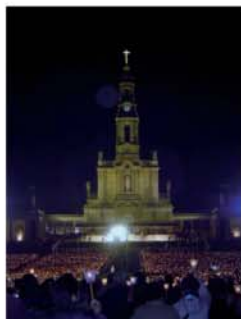
Fatima, lieu du tourisme religieux.

Lisbonne est une destination privilégié de nos communes