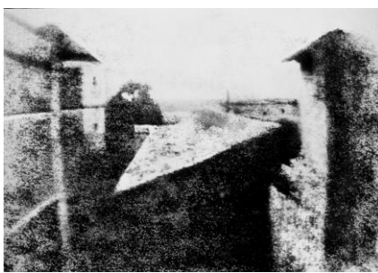
Première photographie en 1827 : vue de sa fenêtre à Saint-Loup de Varennes