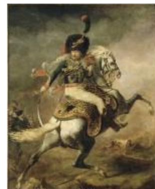
Officier de chasseurs à cheval de la garde impériale chargeant