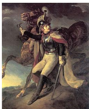
Cuirassier blessé quittant le feu