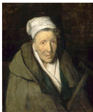
La Folle monomane du jeu

D'autres tableaux de Théodore Géricault !