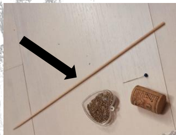
baguette ou long pic en bois