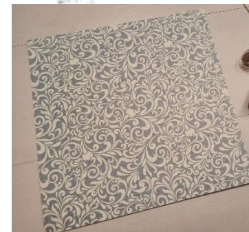
Feuille cartonnée carrée (à motif)