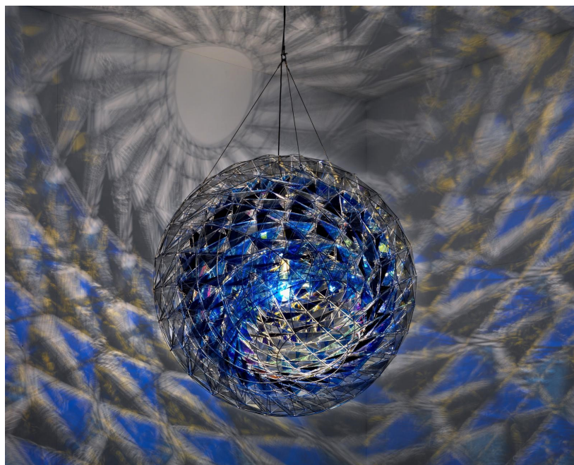
Olafur Eliasson, Cold wind sphere, 2012