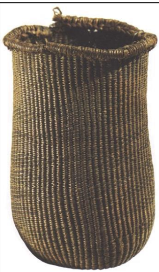
Panier en osier vieux de 5 000 ans