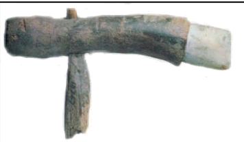
Hache en pierre polie, manche en bois de cerf vieux de 5 000 ans.

Le néolithique est l'âge de la Pierre polie . Celle-ci améliore la vie quotidienne des hommes qui vont faire des outils plus efficaces pour couper les arbres et pour chasser