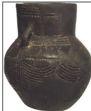
Vase en terre cuite vieux de 6 000 ans

Dans différentes régions du monde, des populations ont découvert qu'en cuisant, l'argile devenait solide. Les hommes ont alors fabriqué toutes sortes de récipients servant à transporter, stocker et cuisiner les aliments.