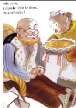
elle cuit, « chaude ! » crie le vieux. « se à refroidir ! »