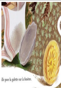
elle pose la galette sur la fenêtre.