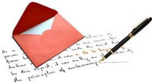
écrire une lettre écrire une lettre