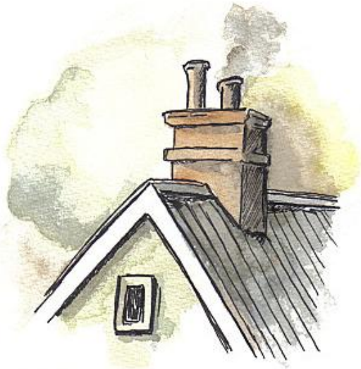
une cheminée sur le toit une cheminée sur le toit