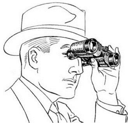
regarder avec des jumelles regarder avec des jumelles

Je sais lire : les - des - sur - pour - mais - dans ma - ra - sa - la - ta - na - ca - pé - da - fa