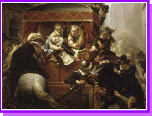
L'assassinat de Henri IV, Charles-Gustave Houssez, 1859

Les mots à ajouter dans la leçon : colonisation - 1589 Édit de Nantes - agriculture catholique - 1598 fanatique - 1610 - 1610 Amérique - Ravallac réconcilier