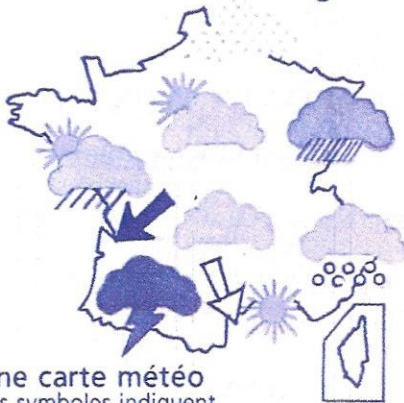
Une carte météo Les symboles indiquent le temps prévu par région.