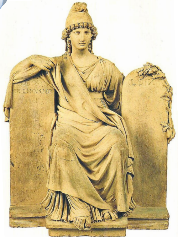
La République réalisée en terre cuite en 1794 par Joseph Chinard.

Source : Histoire-géographie CM2 (Hachette Education)