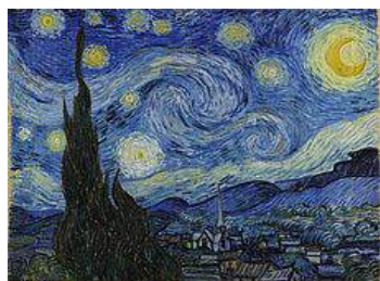
La nuit étoilée