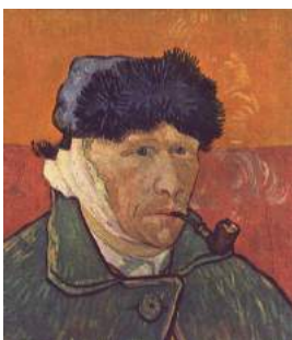
Autoportrait à l'oreille coupée

Van Gogh, très en avance sur son temps, invente le trait brut qui libère l'émotion : Il tape sur la toile à coups irréguliers, laisse les traits tels quels, parfois avec des pâtes de peinture. Il dédaigne les outils coûteux et préfère le crayon, la craie ou encore le roseau "qui laissent des traces" et y mettent du leur pour amener la vie. Parfois il peint même avec son couteau. Il est classé dans les peintres impressionnistes, mais sa peinture annonce le mouvement expressionniste (mettre en avant son émotion face au réel)