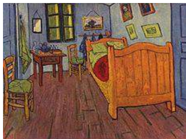
La chambre à Arles

Il aurait pu serrer la main aux peintres Gauguin, Seurat, Monet, Renoir ... qui vivaient à la même époque.