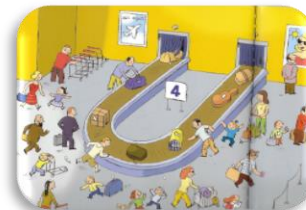
La zone d'arrivée

Chaque bonne réponse te permet de gagner 1 point