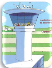
La tour de contrôle