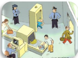
La zone d'embarquement