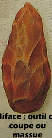
Biface : outil de coupe ou massue