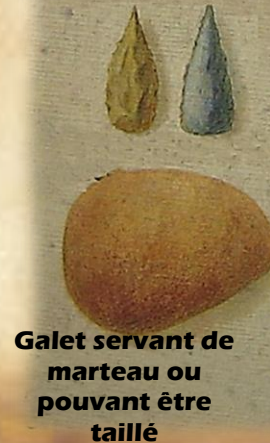
Galet servant de marteau ou pouvant être taillé