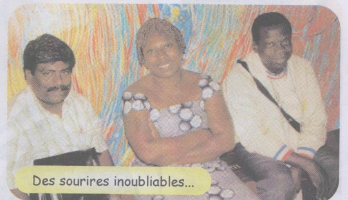
Des sourires inoubliables...