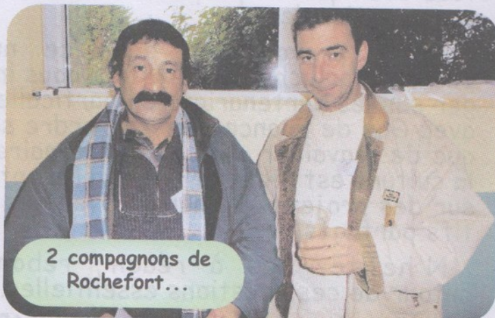
2 compagnons de Rochefort...

"... ce travail va se poursuivre au sein d'Emmaüs dans le Groupe de Travail "Compagnons" du CBC, dans les régions, mais aussi dans toutes les associations locales. A ce titre, le CBC souhaite, dans chacune de vos communautés, maintenir le lien avec un correspondant qui recevra les documents relatifs à la Branche Communautaire et pourra les diffuser aux autres compagnons..."