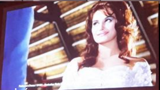
Dalida au cinéma