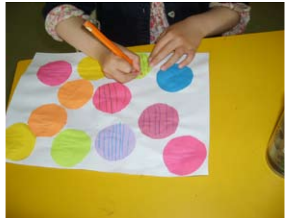
L'outil scripteur est parfaitement tenu.

L'enfant est assis correctement sur sa chaise, les deux pieds bien à plat, le dos droit et les mains sur la table, prêtes à accueillir la feuille.