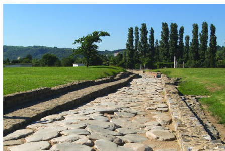
Une route à Saint-Romain-en-Gal