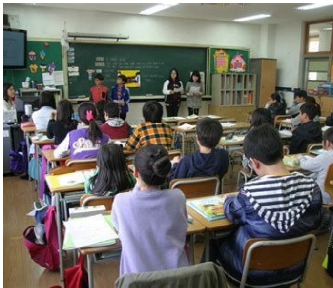
La salle de classe