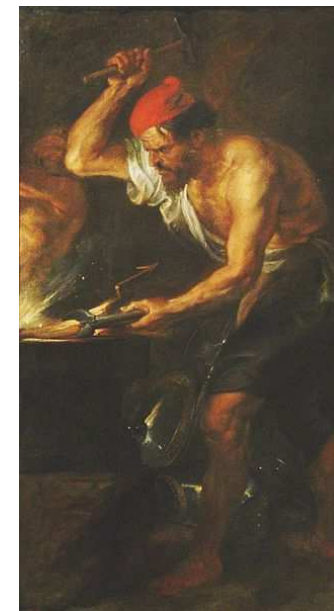
Héphaïstos forgeant la foudre de Zeus par Rubens, Musée du Prado, Madrid

4) Qui attaque la caverne de Pholos et pourquoi ? _____