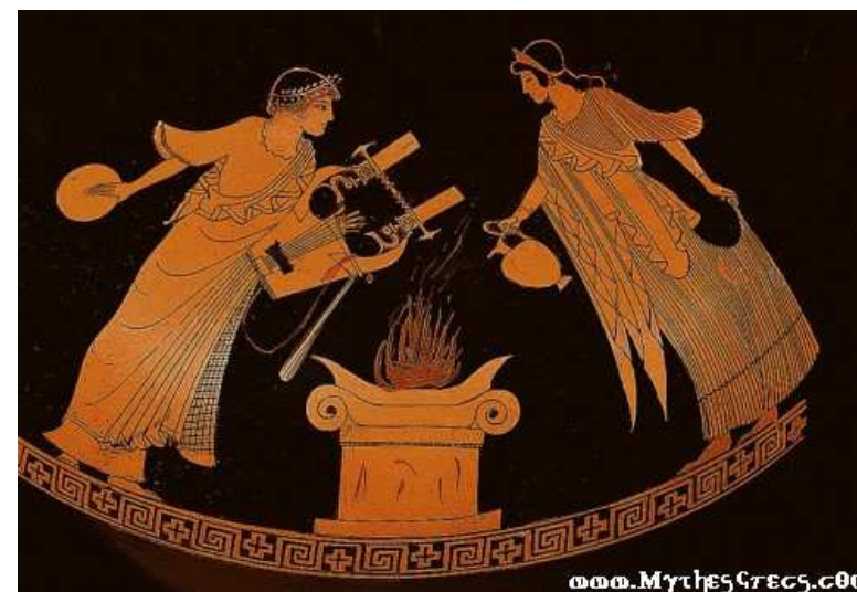
Apollon et sa sœur jumelle Artémis, 500-490 av. J. C.