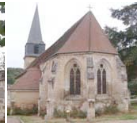
église Saint-André #