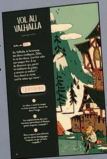
Difficulté (de 1 à 3)

Voici l'énigme à résoudre avec son niveau de difficulté. À toi de reconstituer tout ce qui s'est passé et de répondre aux questions posées.