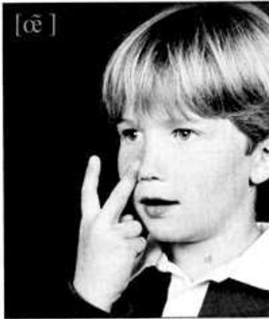
C'est le [œ] de « un ».

Tu mets le u contre ton nez pour dire [œ].