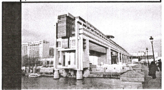
ministère = grand bâtiment où travaillent les services sous les ordres du ministres