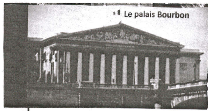
Assemblée Nationale siège des députés élus par le peuple