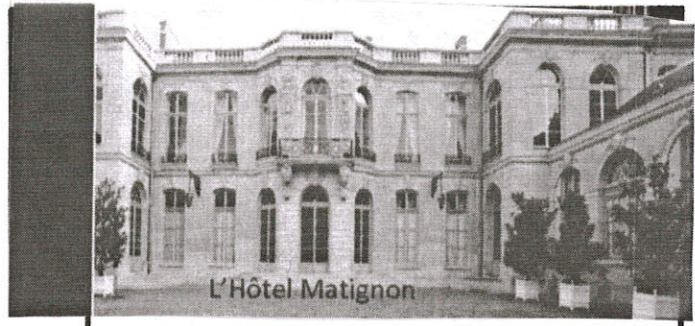
L'Hôtel Matignon POUVOIR EXECUTIF

Ils font appliquer les lois. Le president il nomme son 1 er ministre, represente la France à l'étranger, il est le chef des armées