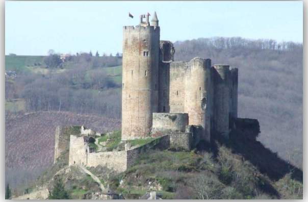
Doc.1 : Le château fort de Najac aujourd'hui

Le château fort est construit en général près d'un village, sur une butte naturelle ou artificielle pour voir de loin les attaquants arriver. Cette disposition permet aussi de rendre l'assaut plus difficile car les assaillants doivent monter une pente. Les premiers châteaux étaient construits en bois . Plus tard, on les bâtit en pierre et on les protégeait par des remparts.