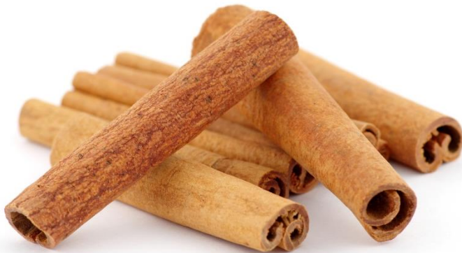
De la cannelle.