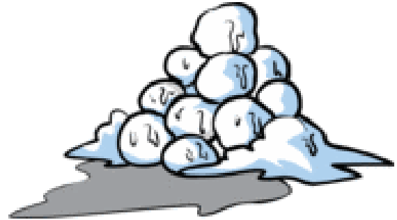
Des boules de neige.