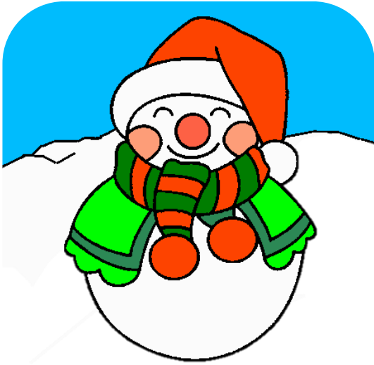
Un bonhomme de neige.