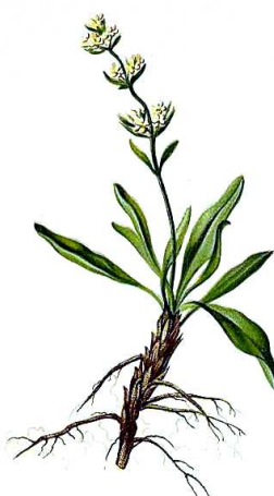
1c. Valeriana celtica