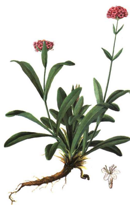
1a. Nardostachys jatamansi

Nardostachys jatamansi - Nardostachys sinensis - Valeriana celtica