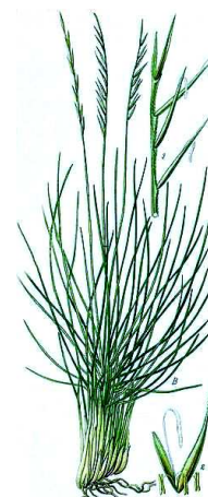
2. Nardus stricta