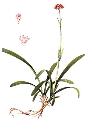
1b. Nardostachys sinensis

2. - Le genre Nardus , avec l'espèce Nardus stricta , ou Nard raide, de la famille des Poaceae (graminées), plante herbacée des pelouses et landes acides, assez commune en montagne (Alpes, Pyrénées...), où elle forme des touffes non consommées par les ovins.