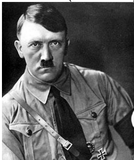
Winston Churchill (1874-1965)