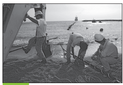
Doc. 4 Pose d'un réseau de câbles sous-marins reliant la France à Singapour et l'Algérie.

6. Quelles infrastructures sont nécessaires pour que le réseau Internet mondial fonctionne ?