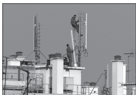
Doc. 3 Installation d'une antenne relais sur le toit d'un immeuble.