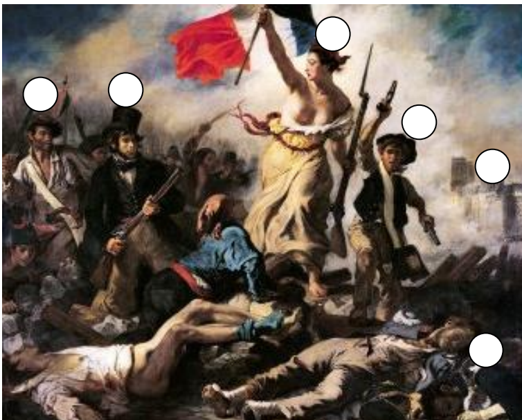
La liberté guidant le peuple. E. Delacroix. Hommage à la Révolution de 1830

2 Explique, à partir de ces images, pourquoi la Révolution de 1830 a éclaté ? Complète la légende du tableau de Delacroix.