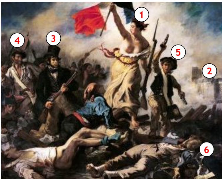
La liberté guidant le peuple. E. Delacroix. Hommage à la Révolution de 1830

Charles X supprime certaines libertés et la censure se durcit. Les bourgeois ne sont pas prêts à accepter Une nouvelle Monarchie de droit divin et provoquent la révolution de 1830.