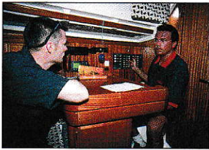
Connaître le panneau électrique.