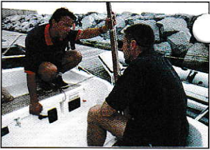
Suivre la mise en route du moteur.