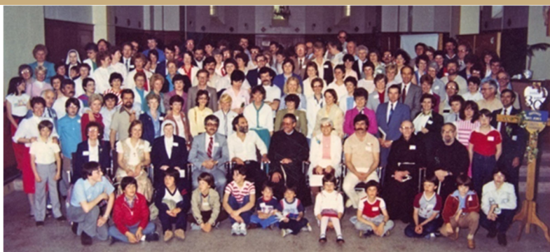
Photo prise lors du 30 e en 1983