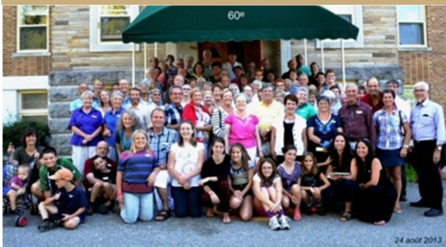
Photo prise lors du 60 e en 2013