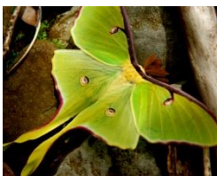
a luna moth