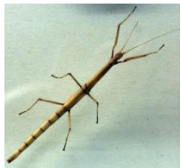
a walking stick