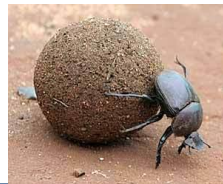
a dung beetle