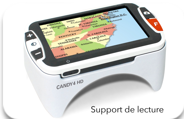
Support de lecture