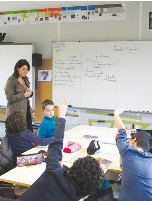
Les élèves de cycle 3 de Chrystelle Météreau en atelier de compréhension de texte