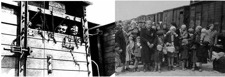
Des wagons entraînaient les juifs vers les camps de concentration. Ils étaient entassés comme des bestiaux.

Dans ces camps, hommes, femmes et même les enfants étaient contraints à des travaux pénibles et à une vie très dure. A peine nourris, ils étaient soumis aux mauvais traitements et vivaient dans la terreur. Beaucoup d'entre eux ne survivaient pas à ces traitements et mouraient.