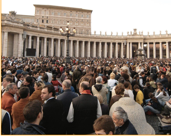
Annnonce de l'élection du pape Benoît XVI au Vatican, à Rome en 2005.

Vous allez pouvoir maintenant étudier cette image. Montrant deux événements similaires à des époques différentes.