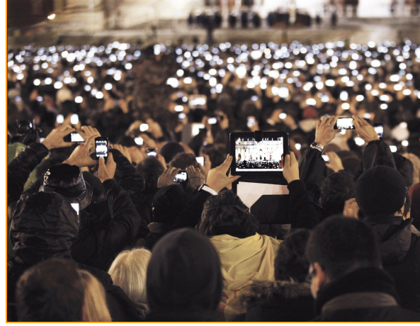
Annnonce de l'élection de l'actuel pape François I au Vatican, à Rome en 2013.

De la même manière vous allez devoir répondre à des questions, qui seront disponibles ici dans ce questionnaire. Regardez attentivement les images avant de répondre aux questions, elles seront également placées à nouveau dans le questionnaire : )