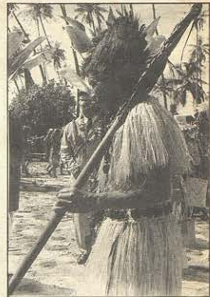
Orero Tongien. Te tahi orero no Rarotoā mai.