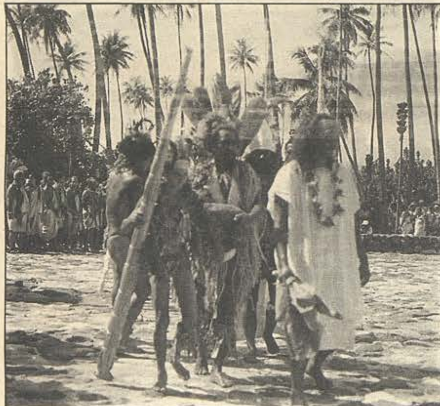
Te taeraa mai te Rapa Nui e te òfai.