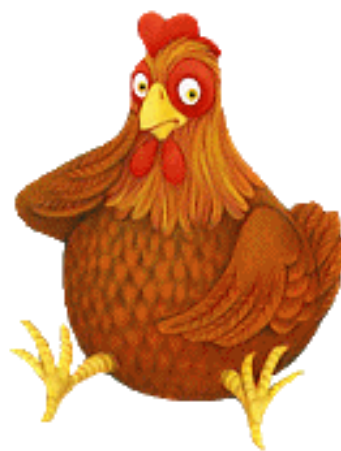
une poule rousse