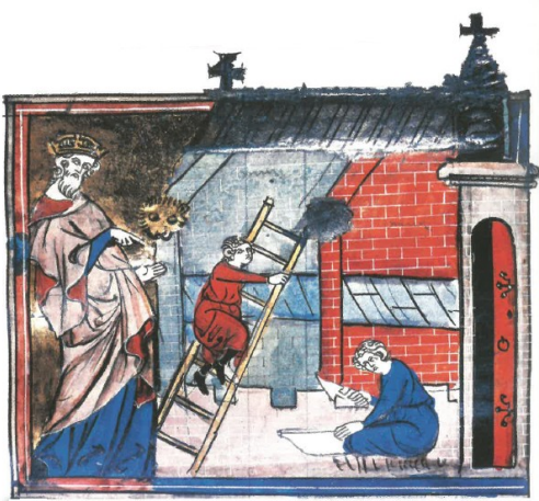
La construction du palais impérial

A partir de 801, Charlemagne établit sa capitale à Aix-la-Chapelle plutôt qu'à Paris. Le centre de l'Empire est donc placé à l'Est du territoire. L'empereur y fait construire un grand palais où il réside. Il y crée une bibliothèque ainsi qu'une école pour former la future élite de l'Empire. La ville devient alors un centre culturel important, à partir duquel se déploie un mouvement de renaissance des arts et des lettres souhaité par l'empereur.