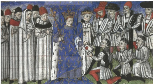
Les missi dominici, miniature, XVe siècle

Pour gouverner son très vaste empire, Charlemagne le divise en 300 comtés et nomme un comte à la tête de chacun d'eux pour le diriger. Les comtes doivent faire respecter les lois de l'empire sur le territoire qu'ils ont en charge. Ils sont placés sous le contrôle des missi dominici qui s'assurent de leur obéissance et de leur fidélité à l'empereur. Ces envoyés de l'empereur vérifient que les décisions de Charlemagne sont correctement appliquées.