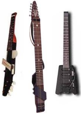
le chapman stick