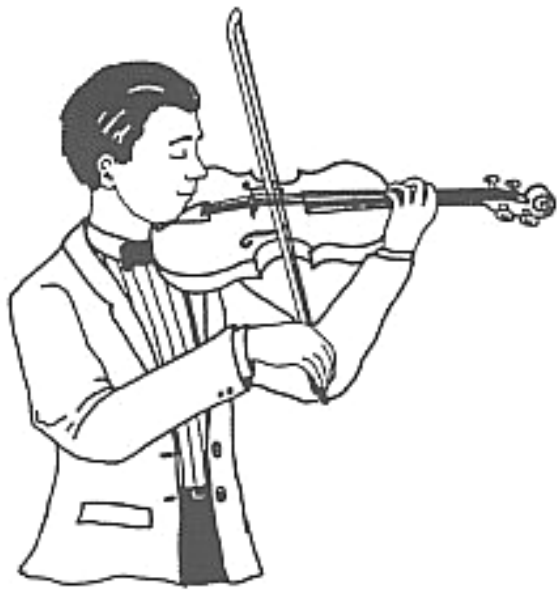
Violoniste ou Altiste