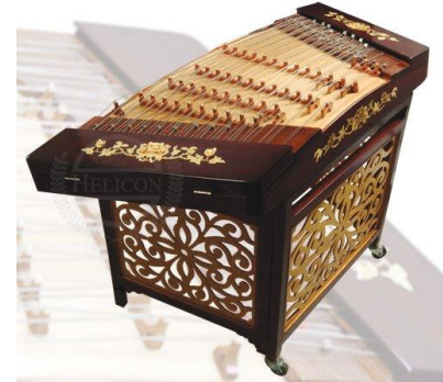
le yang qin