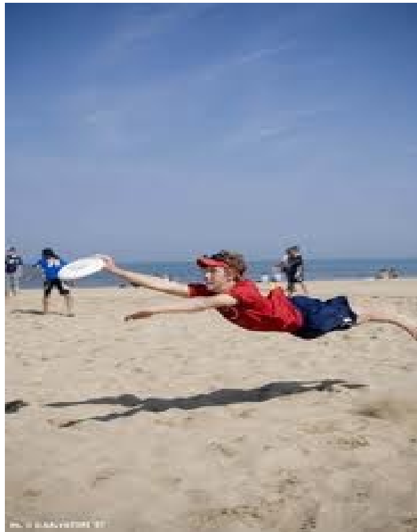
Un lanceur de frisbee

La société américaine Wham-O met au point un petit disque de plastique que l'on doit lancer d'une personne à l'autre, appelé " frisbee ". C'est un représentant de Wham-O qui eu l'idée d'inventer ce jeu en observant des étudiants de l' université de Yale jeter des tartes dans le ciel.