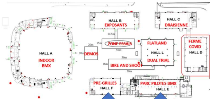
ACCES AUX HALLS F et E pour LES ESPACES TENTES

Les PASS devront être récupérés à votre arrivée au HALL G (accueil général de la manifestation).