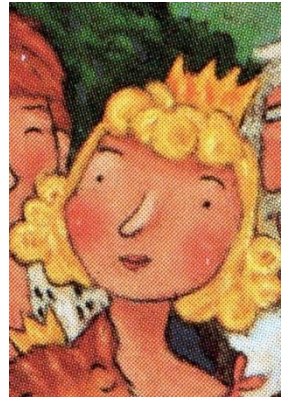
LA PRINCESSE la princesse