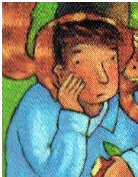
LE MARQUIS DE CARABAS le marquis de Carabas