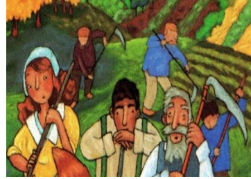
LES PAYSANS les paysans