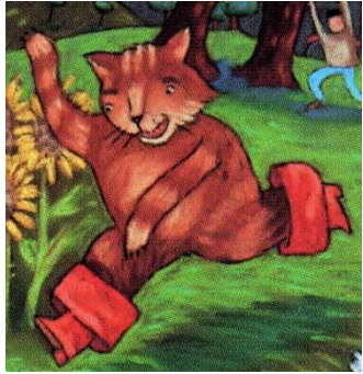
LE CHAT le chat